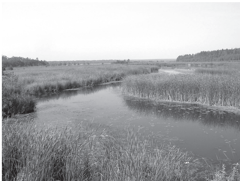
Рис. 1. Река Пазелинка в районе устья — местообитание Aegagropila linnaei.

River Pazelinka in the mouth area — habitat of Aegagropila linnaei.